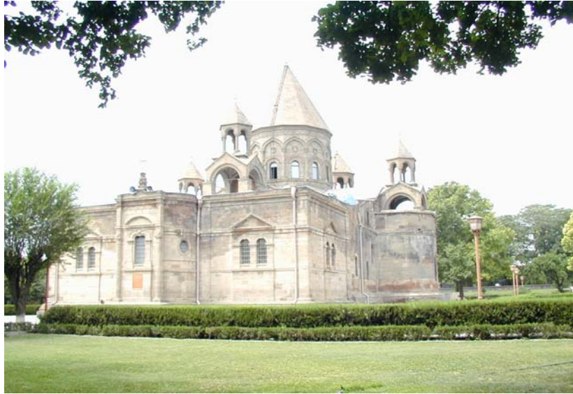
Մայր աթոռ Ա.Էջմիածին Mother See of Holy Etchmiadzin