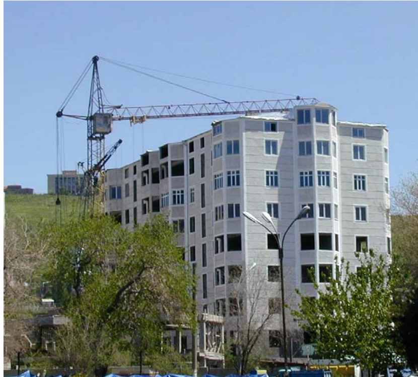
ՇԱՐԱԳՈՐԾՄԱՆ ՀԱՆՁՆՎԱԾ ԲՆԱԿԵԼԻ ՇԵՆՔԵՐԻ ԸՆԴՀԱՆՈՒՐ (ՕԳՏԱԿԱՐ) ՄԱԿԵՐԵՍԸ TOTAL FLOOR SPACE (ACTUAL LIVING SPACE) OF OPERATED RESIDENTIAL BUILDINGS