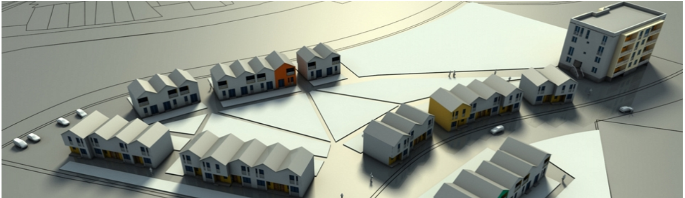
Բնակարանային ֆոնդ Housing stock