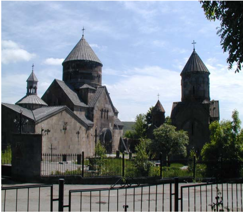
Կեչառիսի վանքը Ծաղկաձորում