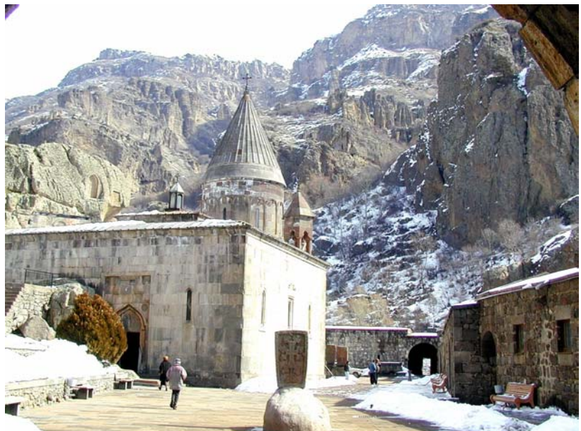
Շկեղեցի Գեղարդ գյուղում