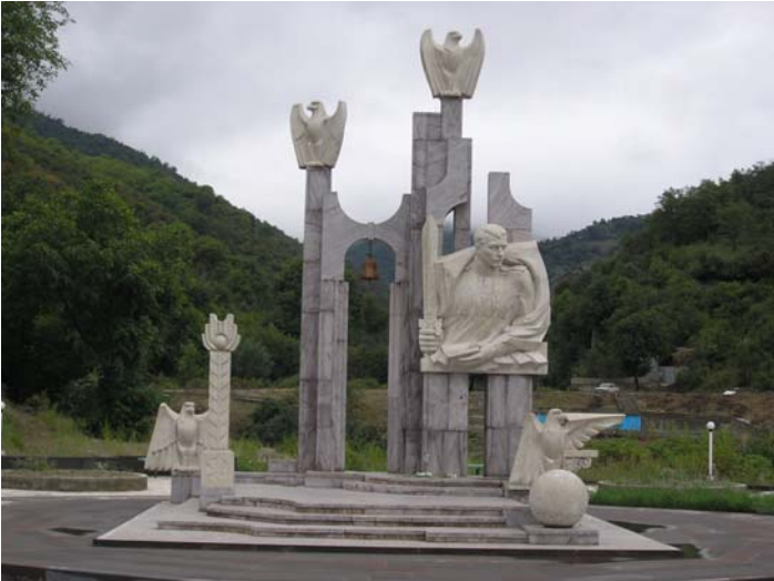
Գարեգին Նժդեհի հուշարձանը