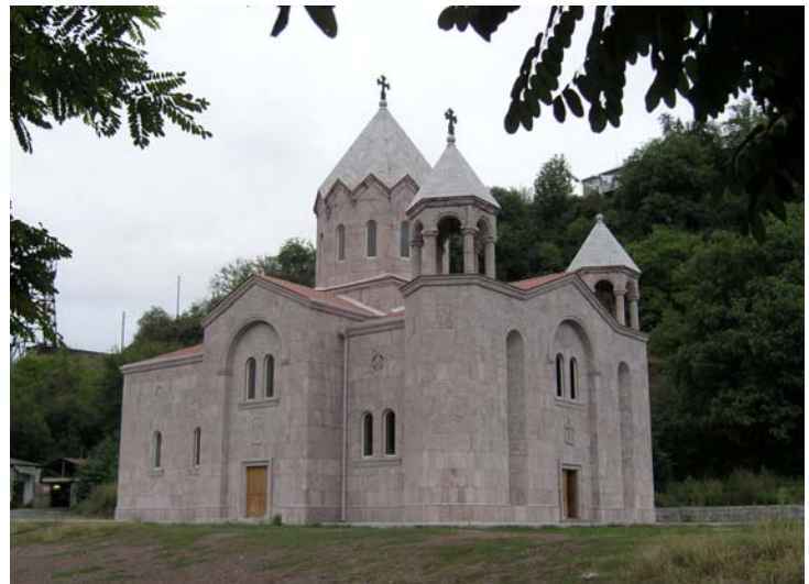
Եկեղեցի Կապան քաղաքում