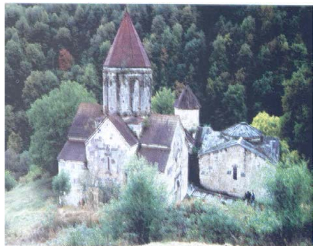
Հաղարծնի վանքային համալիր (XI-XIII դար)