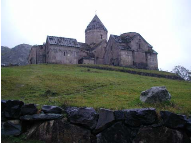
Գոշավանքի համալիր (XII-XIII դար)