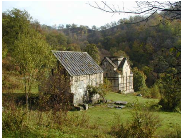
Ջուխատակ վանքը Դիլիջանում