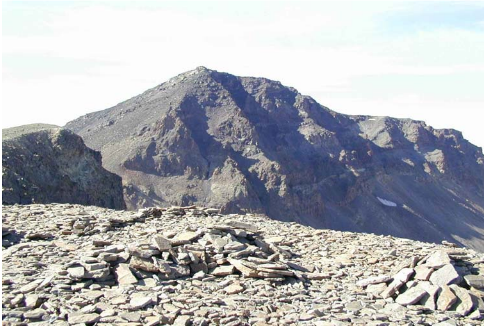
Արագած լեռան գագաթը ԼԵՌՆԱԳԱԳԱԹՆԵՐԸ