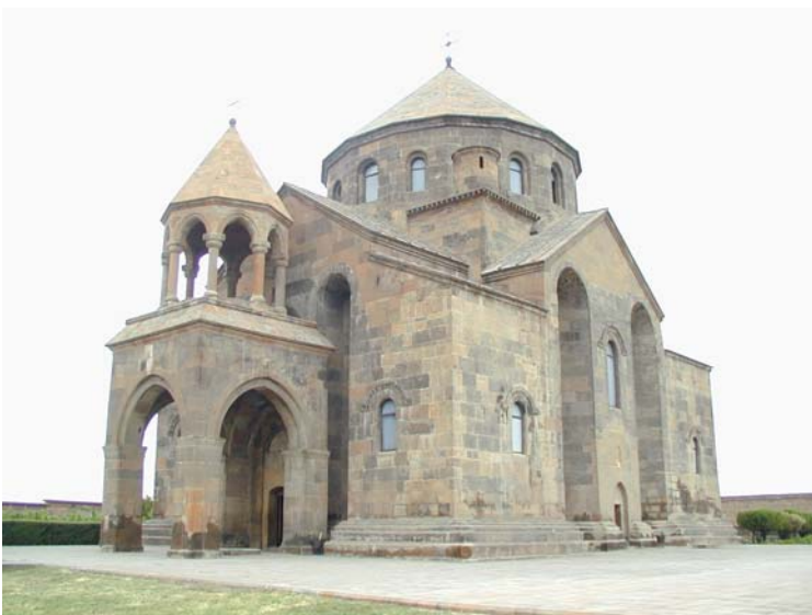
Մուրբ Հռիփսիմեի տաճարը Վաղարշապատ քաղաքում

Մարզկենտրոնից 36 կմ դեպի արևմուտք` Երասխ և Ախուրյան գետերի միախառնման տեղում, գտնվում են Հայաստանի հնագույն մայրաքաղաքներից մեկի` Երվանդաշատի , Երվանդունիների թագավորության վերջին մայրաքաղաքի ավերակները: Հին Հայաստանի այս մայրաքաղաքը կործանվել է 360թ.-ին: Առ այսօր պահպանվում են Երվանդաշատի ավերակները, պարիսպների հետքերը, երկու եկեղեցիների ավերակները և վիմագիր արձանագրությունները: Քաղաքի տեղում այժմ գտնվում է Երվանդաշատ գյուղը: