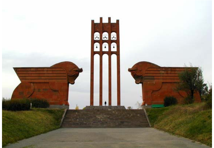
Մարդարապատի ճակատամարտի հուշահամալիրը