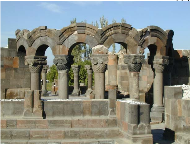
Ջվարթնոց տաճարի ավերակները