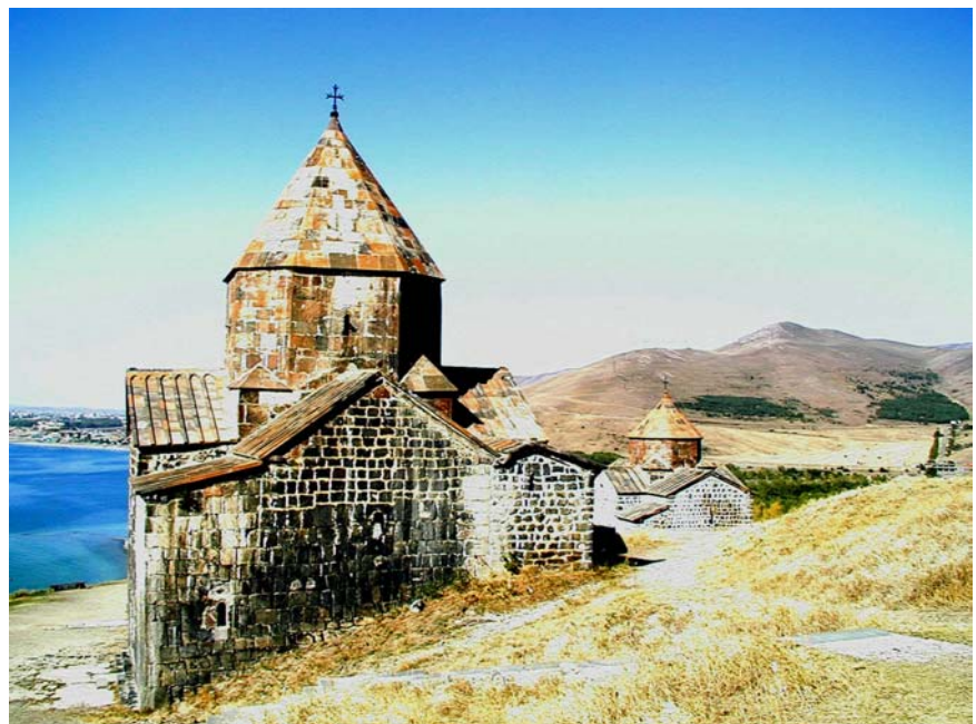
Թերակղզու Սուրբ Առաքելոց և Սուրբ Կարապետ եկեղեցիները, 874թ.