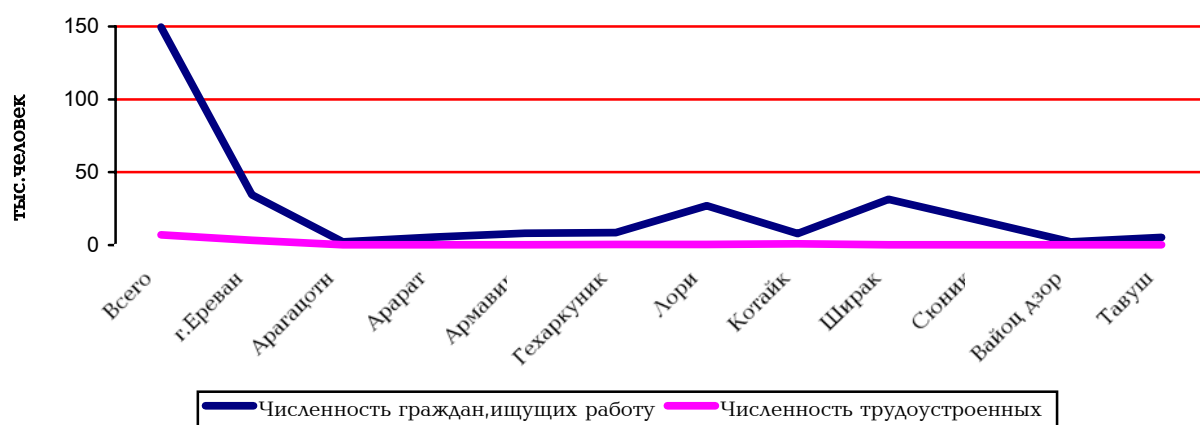
Соотношение численности трудоустроенных к численности граждан ищущих работу по марзам в конце ноября 2003г.

Женщины составили 68.5%, от общей численности официально зарегистрированных безработных. Их удельный вес по сравнению с ноябрем 2002г. увеличился на 1.5%. Официально заявленная потребность в рабочей силе в конце ноября 2003г. составила 633 человека, в том числе 79.3% или 502 человека – по рабочим профессиям. Нагрузка одной вакансии составила 234 незанятых граждан, увеличиваясь на 2.2% по сравнению с октябрём, а по сравнению с соответствующим периодом прошлого года на 25.8%.