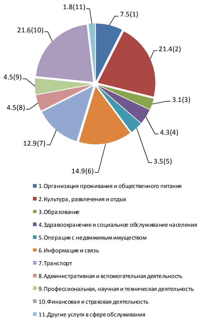
Структура услуг за январь-июль 2018г.