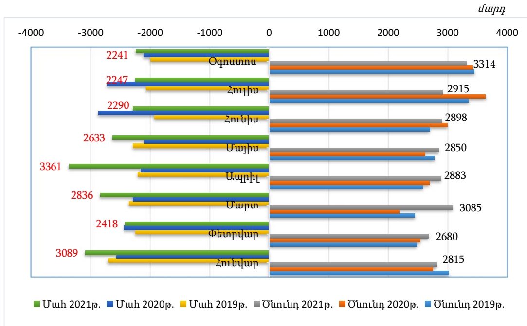
ՀՀ բնակչության բնական շարժի հիմնական ցուցանիշները, հունվար-օգոստոս