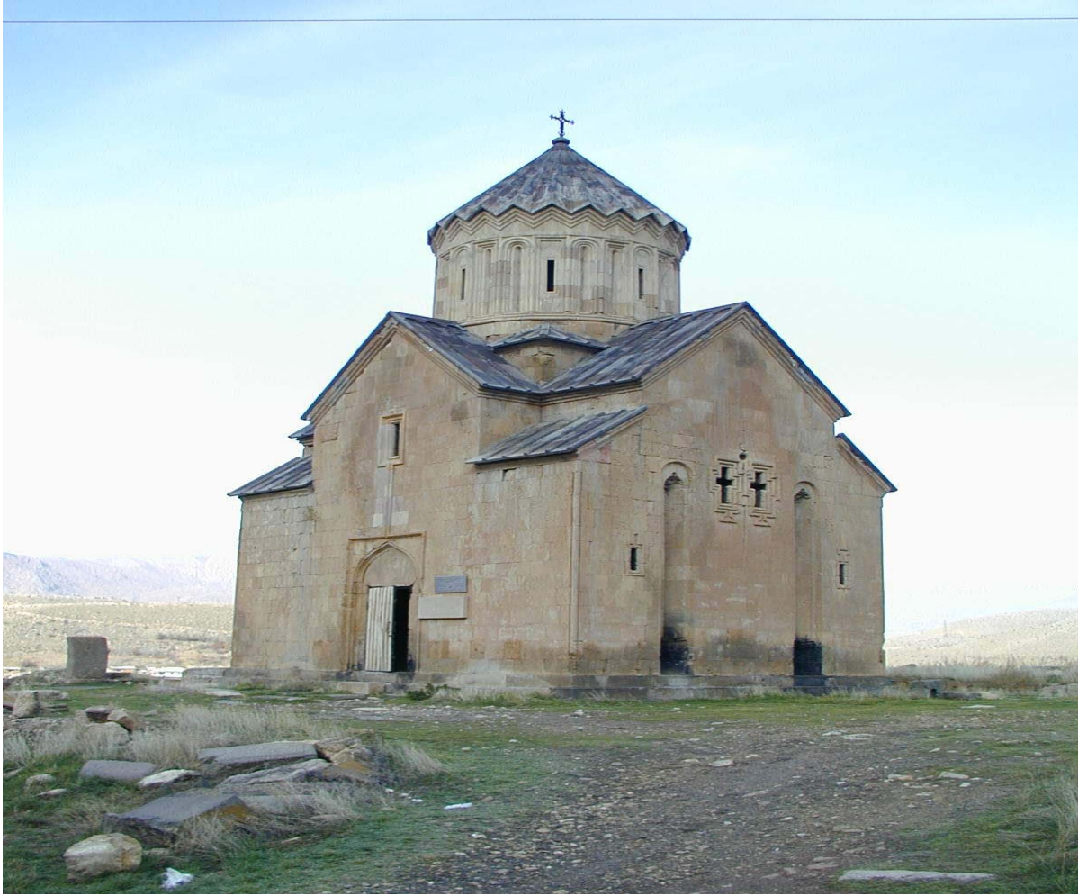
ԾԻՆՆԱԿԱՆ ԵՐԿՐԱՆՆԵՐԻ ԿԱՏՈՒՄ