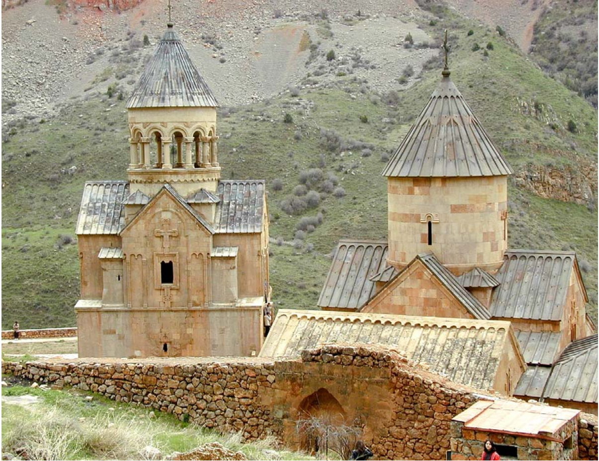
Ման՝ 1՝ Կն