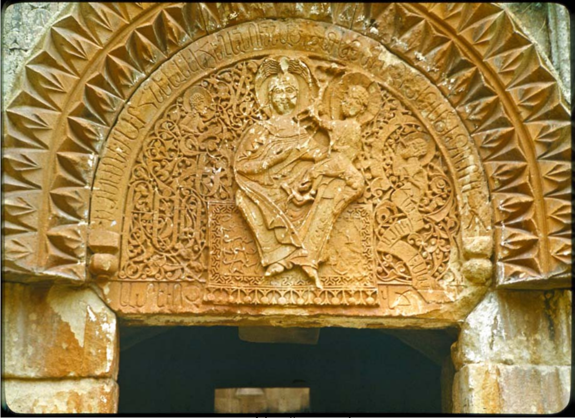
ԾՅ Ի ԻՅ ԻՅՆ ՍԱՆՅ ԻՅ ԿՈՇ